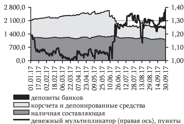
Рис. 18. Динамика составляющих рублевой денежной базы и денежного мультипликатора, млн руб.

Результатом наблюдаемых процессов на денежном рынке республики стал рост денежного мультипликатора M2x (отношение национальной денежной массы и денежной базы) с 1,19 до 1,38 по итогам отчетного периода.