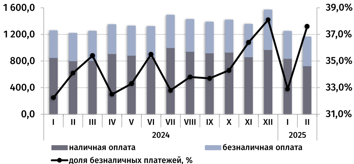
динамика потребительского рынка, ежемесячно (в текущих ценах, млн руб.)